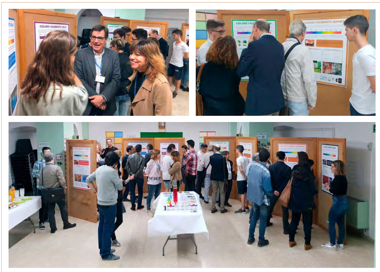
Figura 6. Recorregut pels pòsters científics.