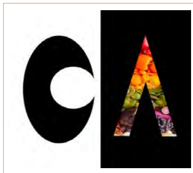
Figura 3. Logotip dissenyat pels alumnes.

— Es va acordar entre tots el nom del congrés i se'n va dissenyar el logotip (fig. 3). També es van elaborar unes invitacions que es van enviar a científics, empreses, l'alcalde i la regidora d'Ensenyament de Martorell i membres de la comunitat educativa (direcció, professorat i AMPA). Alhora, es va preparar la mirada a les xarxes socials, de manera que es va crear un compte de Twitter i un altre d'Instagram amb què difondre l'acte (fig. 4).