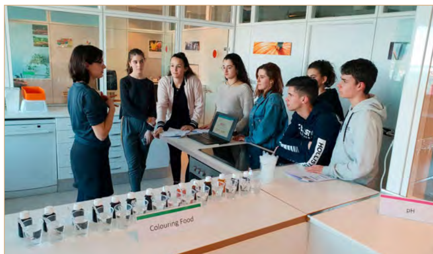
Figura 2. A la seu de GNT Iberia, experimentant amb els seus productes.

El primer pas va ser escollir el color que volia estudiar cada alumne. Seguidament, per tal de complir una de les condicions de l'encàrrec, calia consensuar el format del pòster. Per això, en grup, els alumnes van fer les seves