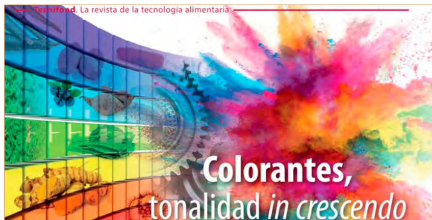
Figura 1. Portada de l'article sobre colorants de la revista Tecnifood .

En aquest article apareixen diversos anuncis d'empreses del sector amb les quals els alumnes van contactar via correu electrònic. Ràpidament, algunes de les empreses, sorpreses en rebre correus electrònics d'alumnes de batxillerat, van contestar molt disposades a col·laborar amb el projecte. Així, l'empresa Proquimac ens va oferir diferents colorants sintètics amb les fitxes