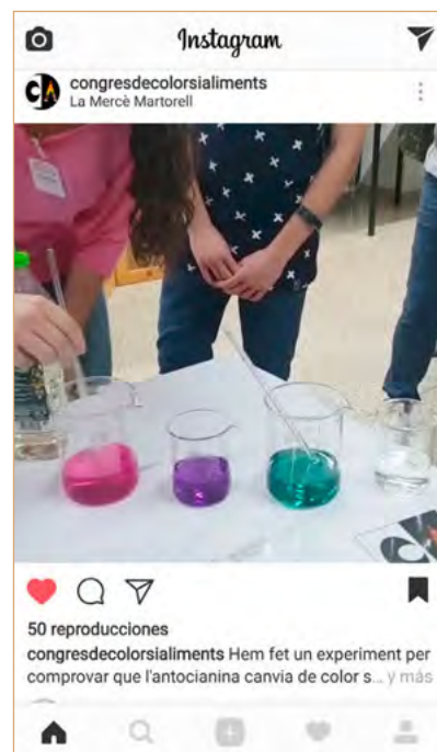
Figura 8. Captura del vídeo penjat a Instagram per veure com la modificació del pH fa variar el color del producte.

La part que caldria millorar seria el postcongrés. Caldria temporitzar alguna sessió de valoració sobre les preguntes, inquietuds, reflexions o, fins i tot, els reptes que alguns dels científics van plantejar als alumnes i editar un document compartit. Caldria fer la rúbrica més acurada de tot el congrés, no únicament de la part dels pòsters, per tal d'avaluar millor